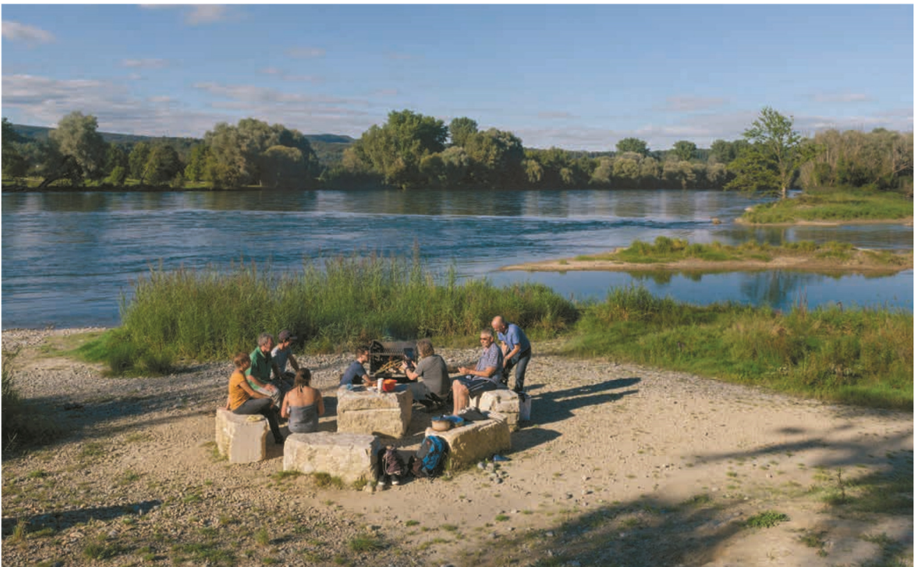
Seit Abschluss der Revitalisierungsarbeiten 2015 ist die Aue Chly Rhy zu einer Attraktion für Ausflügler und Naturfreunde geworden.

Was das heisst, lässt sich zum Beispiel vom Dach eines ehemaligen Bunkers aus erleben, der zu einer Aussichtsplattform umfunktioniert wurde. Von hier aus sieht man