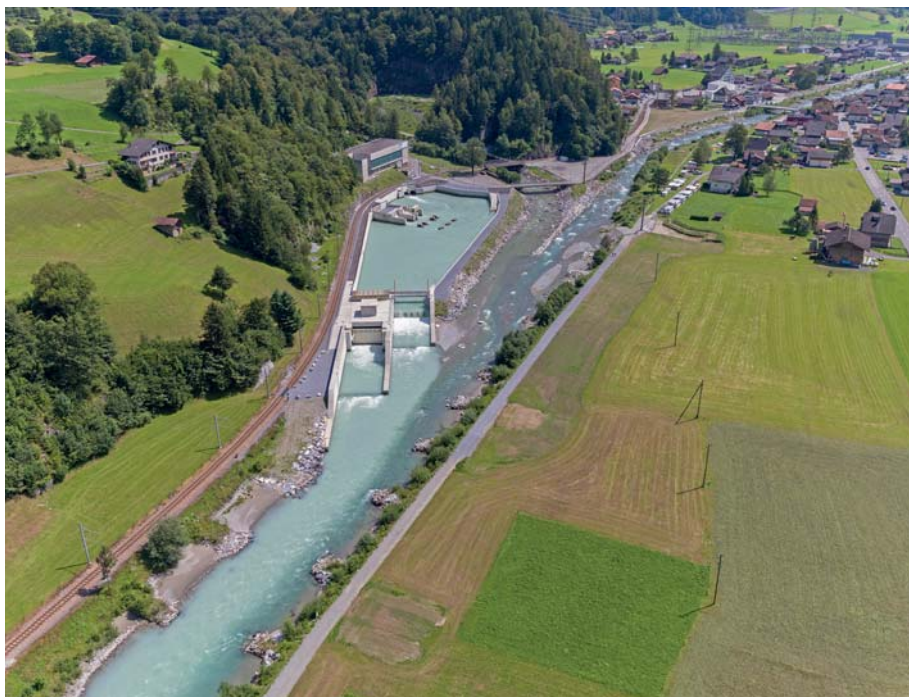
Bild 2a. Ausgleichsbecken Kraftwerke Oberhasli (KWO); Foto: Markus Zeh, Bremgarten.

Die Vermittlung des spezifischen Wissens für die Sanierung Wasserkraft erfolgt primär im Rahmen von Anlässen zum Erfahrungsaustausch und mittels Publikationen. Für die Bereiche Schwall und Sunk wie auch für die Fischgängigkeit sind die von der Wasser-Agenda 21 durchgeführten Erfahrungsaustausche etabliert. Demgegenüber fanden für den Bereich Geschiebe noch kaum Austausche statt. Vereinzelt wird Wissen auch von Verbänden weitergegeben. Lücken sehen die betroffenen Akteure v.a. beim Austausch von internationalem und interdisziplinärem Wissen, z. B. aus Deutschland, und beim