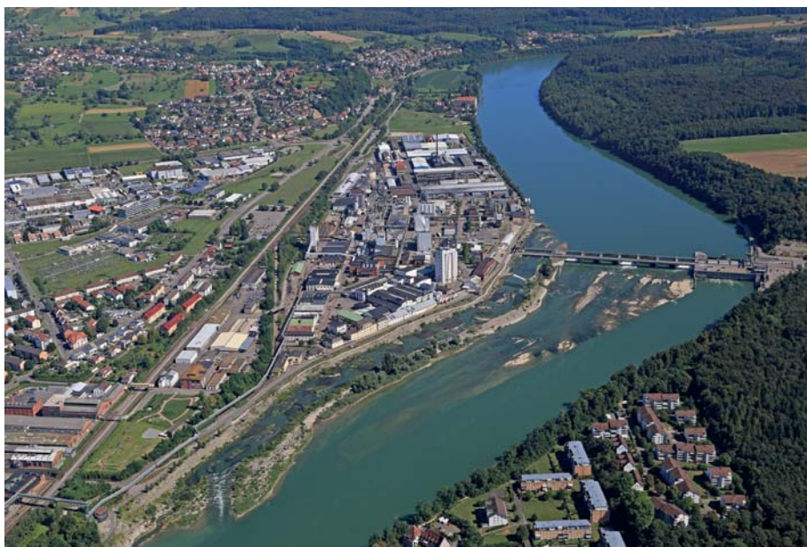
Bild 2b. Kraftwerk Rheinfelden mit Umgehungsgewässer (links) und Vertical-Slot-Fischpass (rechte Uferseite); Foto: Energiedienst.

Angebot an (mehrtägigen) Aus- und Weiterbildungskursen.