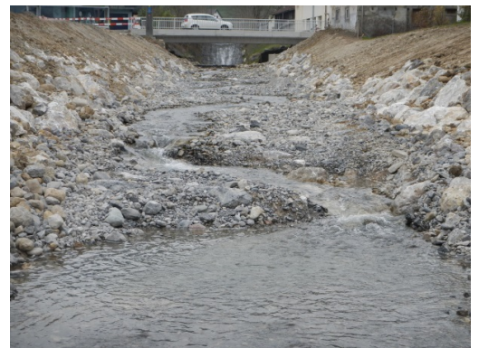
Pendelrampe kurz nach Fertigstellung (April 2013)