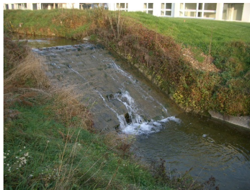
Steile, gepflasterte Rampe mit Schäden (Nov. 2005)