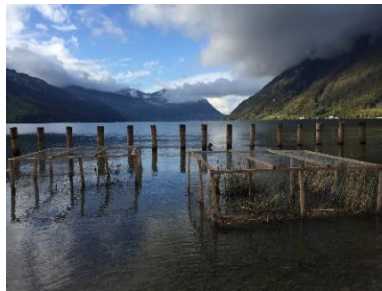
Schwemmholzurückhalt / Schilf