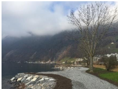
Neues Ufer und Wegführung