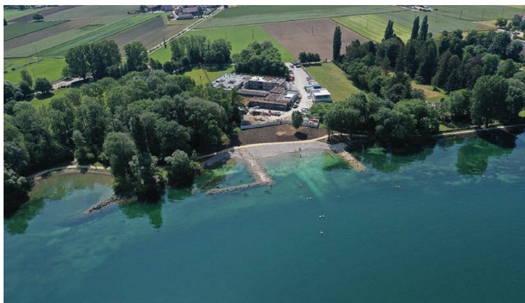
Naturnahe Uferbucht mit einer Flachwasserzone im Bierlesee, Gemeinde Ipsach, kurz nach der Fertigstellung