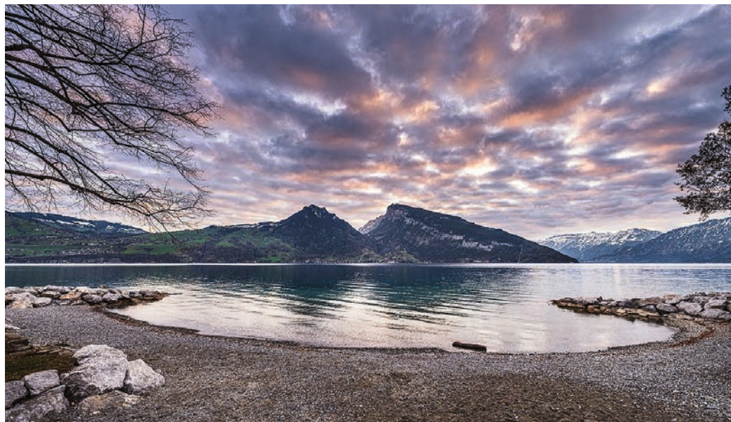
Neu geschaffenes Erholungsgebiet am Thunersee mit einer Flachwasserzone.

Weissfischarten, Trütschen und Groppen einen Unterschlupf. Die Raubfischarten können sich aber auch auf die Jagd nach Beute machen. Die rechte Seite steht der Bevölkerung für die Naherholung zur