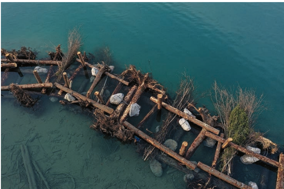
Holzriffe im Brienzersee dienen u. a. als Fischunterstand. Diese Aufnahme erfolgte kurz nach Fertigstellung bei sehr niedrigem Wasserstand. Koordinaten: 2'646'390, 1'176'640

Das Seeufer im Bereich «Im Brunnen» (Gemeinde Brienz) am östlichen Ende des Brienzersees wies gemäss der strategischen Revitalisierungsplanung einen ökomorphologisch naturfremden Zustand mit hohem Nutzen und hohem Aufwertungspotenzial auf. Im Jahr 2022 realisierte die Zentralbahn als Ersatz-